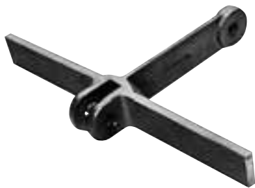
T形アタッチメント